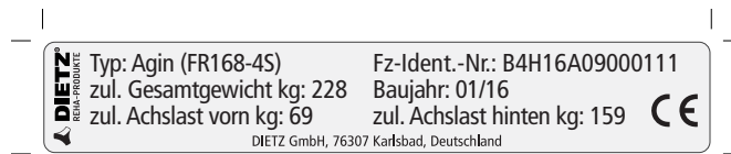
Abb. Typenschild Agin 6 km/h

Das Typenschild befindet sich am Chassis nahe der Vorderachse, auf der rechten Seite in Fahrtrichtung. Fahrzeugtyp und Seriennummer (Fz-Ident.-Nr.) sind am Typenschild zu finden.