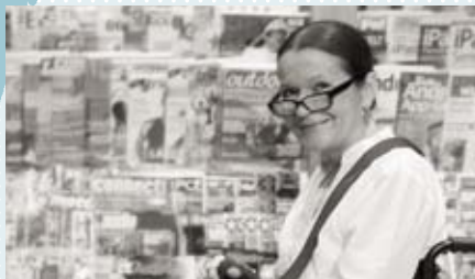
Marianne Seite 16