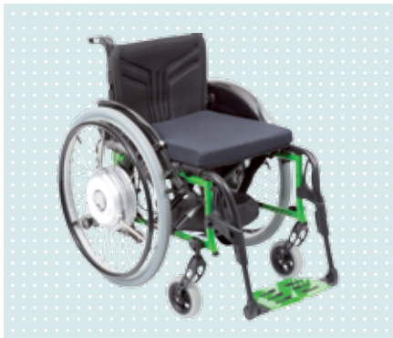
• eSupport am Avantgarde CV