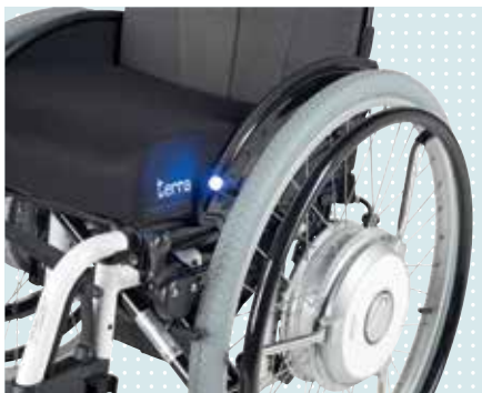
• Umschalter Indoor-/Outdoor-Modus