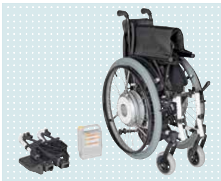
• Einfacher Transport