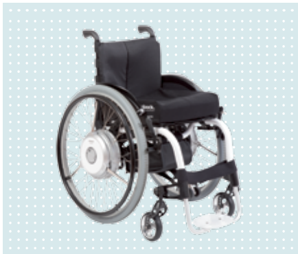
• eSupport am Ventus