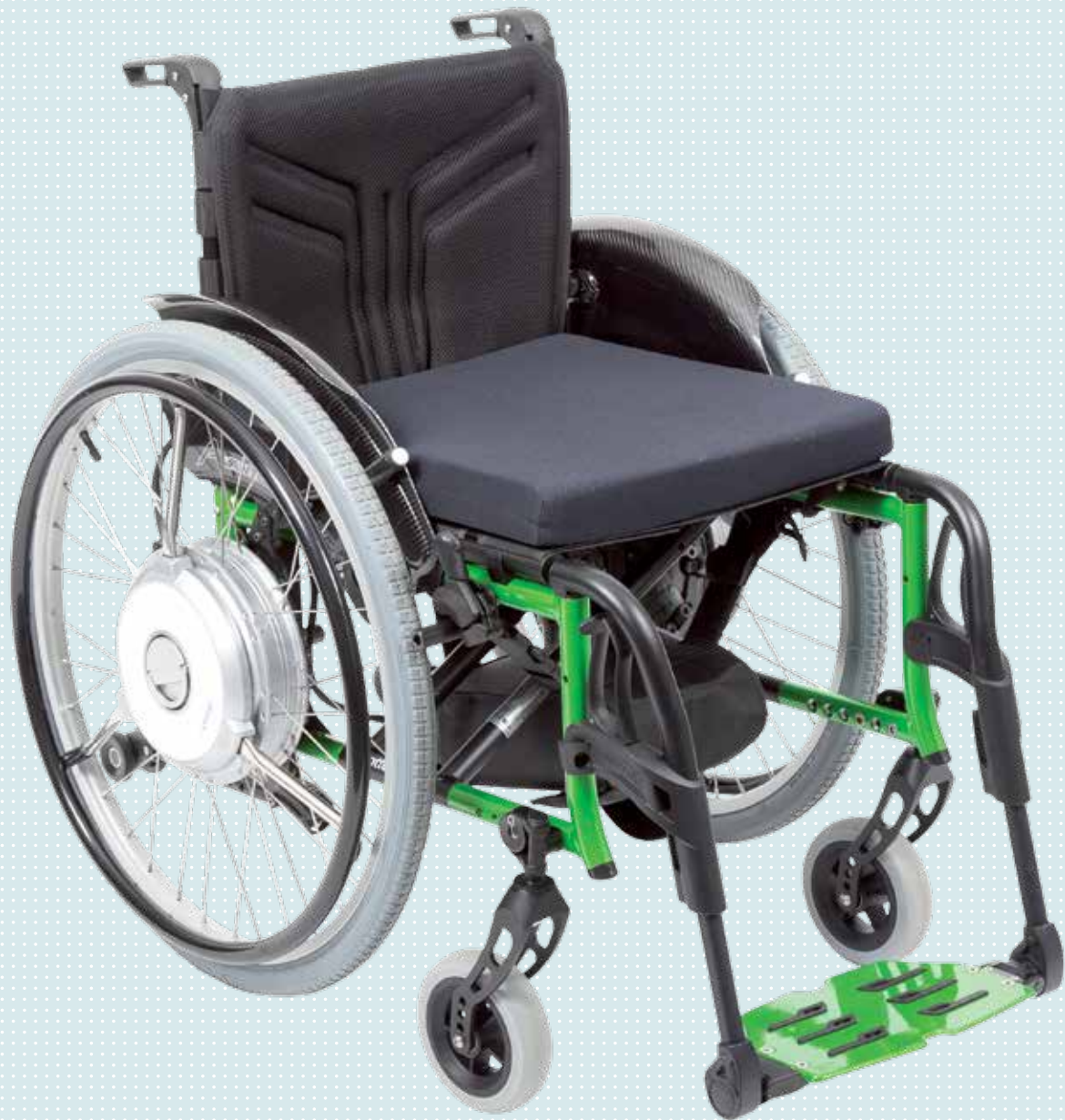
Abbildung zeigt eSupport am Avantgarde