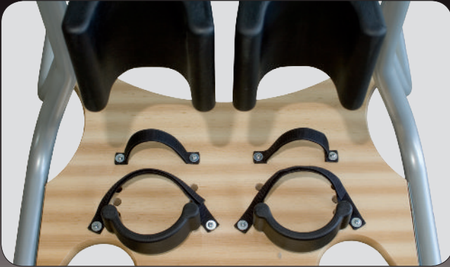
Fußplatte mit Fersenklettbandern Art.-Nr. 02.017.00.000