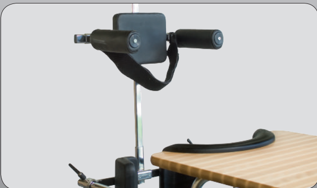
Oberkörperpelotte Art.-Nr. 02.068.00.000