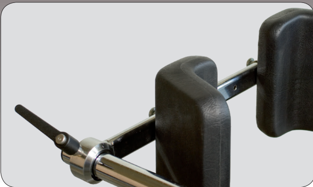
Haltestange mit Pelotten Art.-Nr. 02.010.00.000