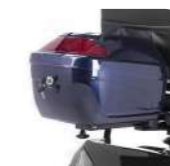
Heckbox Boîte arrière