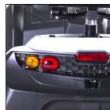
Bremslicht Feux de stop