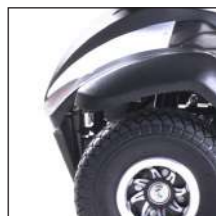
Kompakte Bauweise Construction compacte

Der ideale SBB Begleiter! Compagnon idéal pour voyages en train!