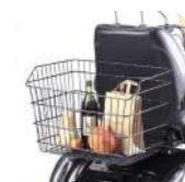
Heckkorb Panier large