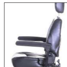
Komfortsitz Siège confortable