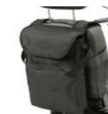
Sitztasche Sac de rangement