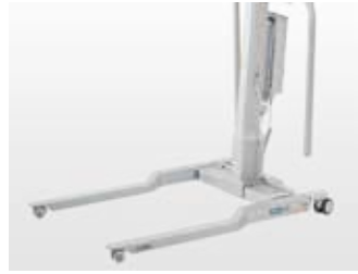
LowBase – Höhe des Fahrgestells