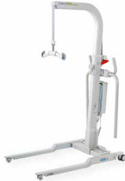
Golvo 9000 LowBase

Der Golvo 9000 Lifter bietet die funktionalen Vorteile eines Deckenlifters mit der Flexibilität eines mobilen Lifters. Zusammen mit dem umfangreichen Angebot an Liko-Zubehör ist der Golvo ideal für alltägliche Hebesituationen in den verschiedensten Pflegeumgebungen.